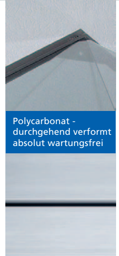
Polycarbonat - durchgehend verformt absolut wartungsfrei

Auf Anfrage sind unsere Abdeckungen in weiteren Sonderfarben lieferbar.