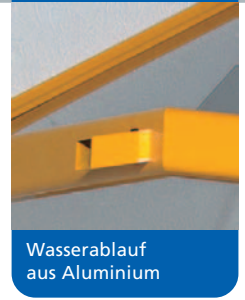
Wasserablauf aus Aluminium

In der linken Abbildung präsentiert sich das Modell Havel in der Sonderbeschichtung RAL 1023I verkehrsgelb und einer Sonderabdeckung in lichtgrau.